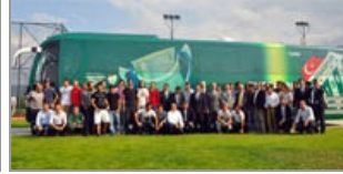
Bursaspor'u deplasman maçlarına MAN taşıyacak